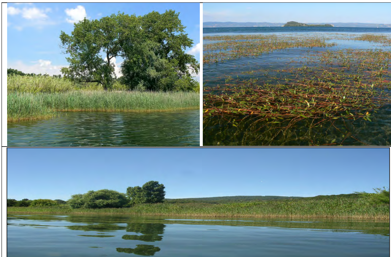
Fino a circa 20 anni fa, erano presenti lungo il lago consistenti tratti ripari con una significativa presenza di canneto a Cannuccia di palude e popolamenti di vegetazione acquatica flottante.